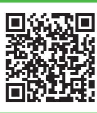
QRコードは株式会社アンソウウェブの登録商標です。

ご入力いただいた住所に払込票をお送りいたします。内容をご確認うえ、お支払いください。